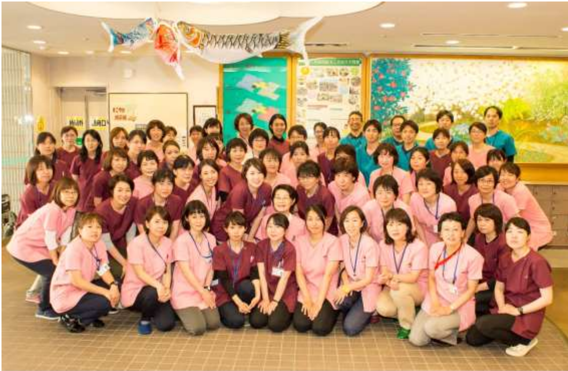
西宮市社会福祉事業団 訪問看護課 平成30年5月16日