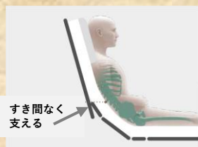
すき間なく 支える